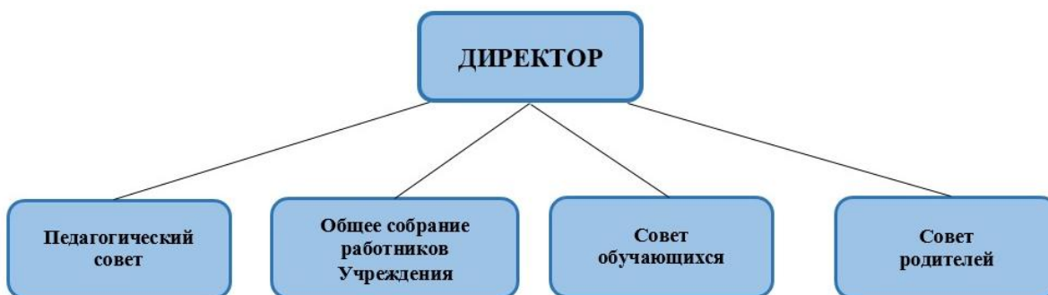
Схема 1. Структура управления